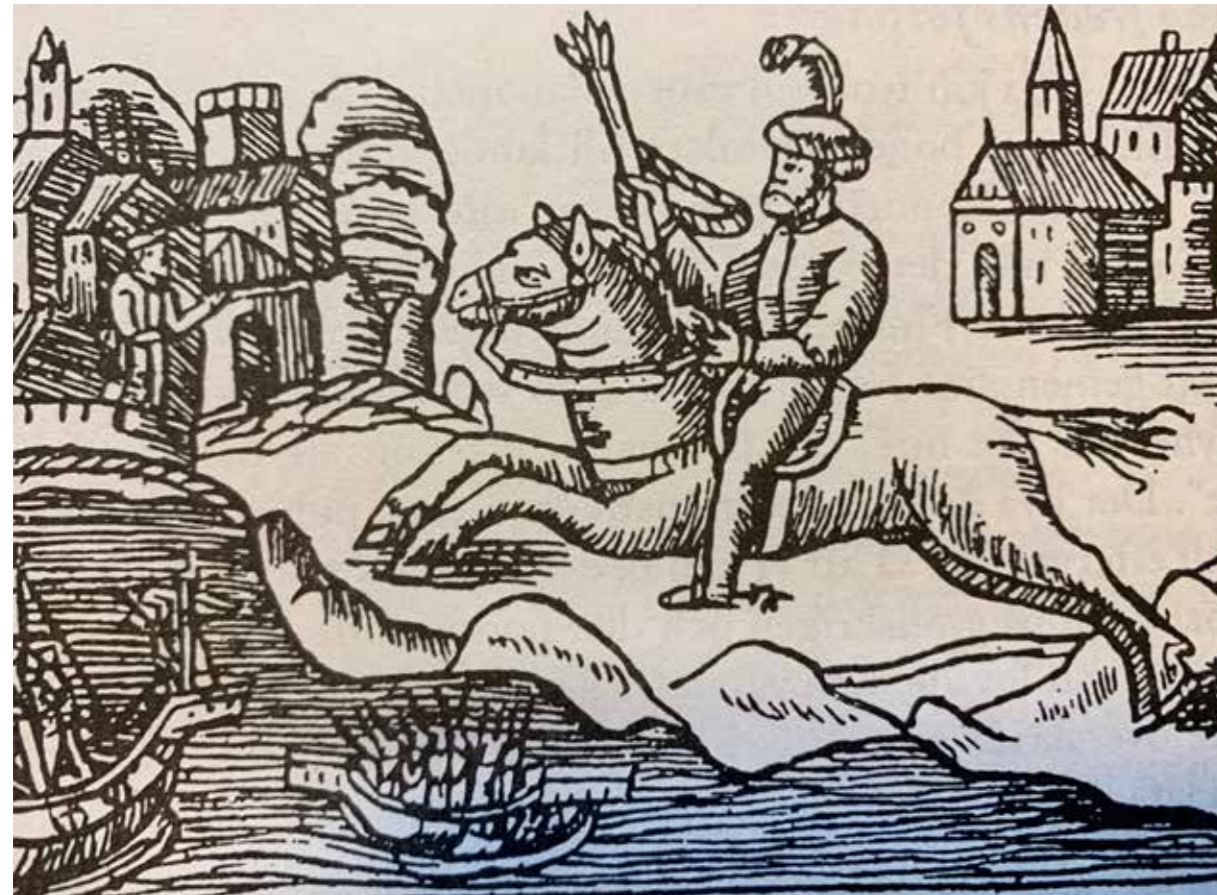
Illustrationen visar en ryttare med budkavle som är "repad och bränd" som uppmanar bygdens vapenföra män till uppror. Den finns i Olaus Magnus "Historia om de nordiska folken"