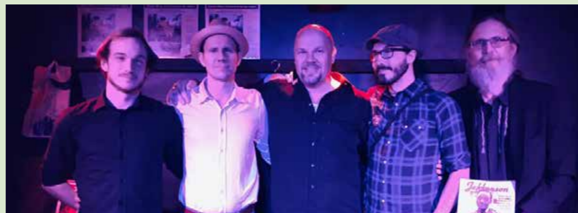
Avid Hill piano